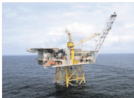
Die Ölplattform Huldra vor Norwegens Küste kann im Internet ersteigert werden. Sie hat nur einen Nachteil: Es gibt keine Garagen.

Die in der vergangenen Woche angelaufene Auktion geht auf der Ebay-ähnlichen norwegischen Tauschbörse www.Finn.no vonstatten. Da kann man gleich einen DVD-Spieler für regnerische Nordseeitage ersteigern oder eine Hoch-